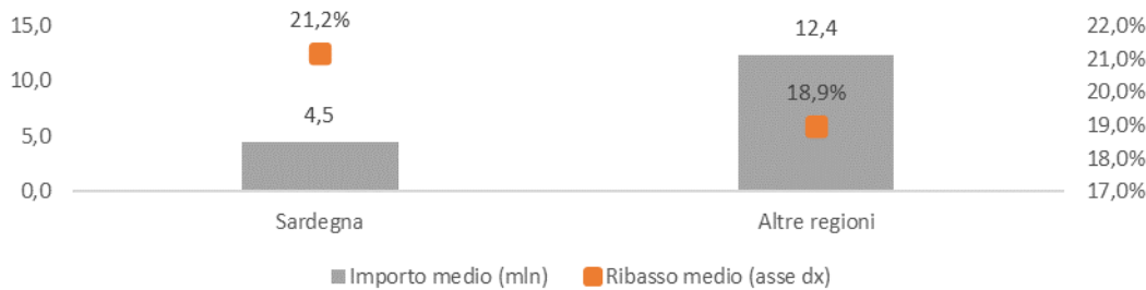
Grafico 2- Ribasso medio e importo medio offerti dalle imprese aggiudicatarie di opere pubbliche di importo superiore a 1 milione in Sardegna – totale 2017-2024